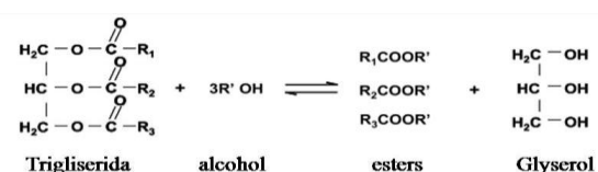
Gambar 2. Reaksi Transesterifikasi