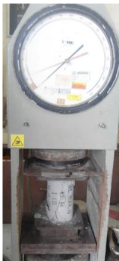
Gambar 1: Pengujian Kuat Tekan