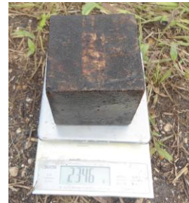
Gambar 2: Pengujian perubahan berat