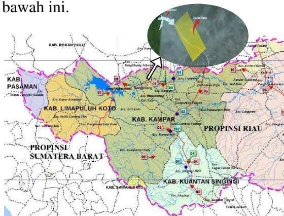
Gambar 1. Lokasi Penelitian Daerah Irigasi Muara Uwai Kabupaten Kampar Propinsi Riau

Penelitian dilakukan pada DI Muara Uwai yang meliputi Desa Muara Uwai kecamatan Bangkinang Seberang, Kabupaten Kampar, Provinsi Riau. Secara geografis DI Muara Uwai terletak pada koordinat 0°22'09,86" LU dan 100°59'14,46"BT. Daerah studi mencakup satu stasiun pencatat hujan yaitu stasiun Pasar Kampar dan satu stasiun klimatologi yaitu Stasiun Pasar Kampar,. Lokasi penelitian dapat dilihat pada gambar 1 di bawah ini.