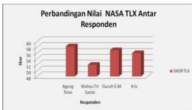
Gambar 3.2 Grafik Perbandingan Nilai NASA TLX Antar Responden

Secara keseluruhan beban kerja mental divisi distribusi produk (tim ekspedisi) pada PT. PTI Semarang tergolong sedang. Hal ini dikarenakan pekerjaan yang dilakukan karyawan divisi distribusi produk (tim ekspedisi) PT. PTI Semarang masih dilakukan dengan cara sendiri-sendiri (individu) belum menggunakan sistem pembagian kerja ( division of