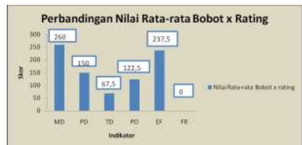
Gambar 3.3 Grafik Perbandingan Nilai Rata-rata Bobot x Rating Antar Indikator

labor ). Jumlah karyawan divisi distribusi produk (tim ekspedisi) yang bekerja hanya berjumlah 4 orang dengan order toko yang banyak dan tidak menentu jumlahnya dimana masing-masing dari mereka dibekali 1 buah truck ukuran sedang untuk mengangkut produk yang akan didistribusikan. Terlebih karyawan divisi distribusi produk (tim ekspedisi) pada PTI ini harus mengantar pesanan yang tersebar seacara luas dan tidak selalu sama sehingga jalur yang dilalui tidak selalu sama, ditambah lagi terkadang retailer atau tokonya berada pada tempat yang cukup terpencil dan ada beberapa yang harus masuk ke dalam pasar induk padahal dengan pekerjaan sebanyak itu ditangani oleh 1 karyawan yang berkerja sebagai driver sekaligus yang mengantarkan produk ke retailer atau tokonya langsung. Tugas yang cukup berat ini apabila terjadi beban kerja yang berlebihan pada karyawan divisi distribusi produk (tim ekspedisi) pada PT. PTI Semarang ini maka tentunya akan mempengaruhi produktivitas perusahaan secara keseluruhan.