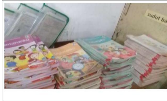
2 Buku yang digunakan dalam pengasuhan

Buku yang digunakan oleh anak jalanan rata-rata belum memuat kesantunan berbahasa. Selain melakukan observasi macam buku yang digunakan dalam pengasuhan, peneliti juga melakukan wawancara terhadap pengasuh dan anak jalanan.