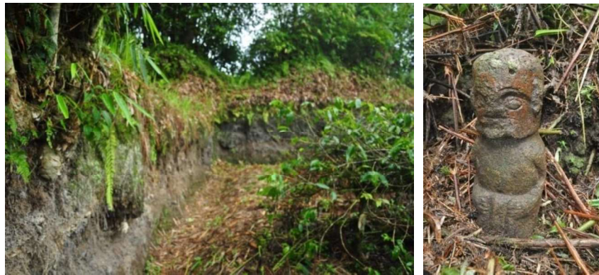
Gambar 2. Bagian sudut barat laut Parik Pandiangan dan panghulubalang di depan Parik Lumban Gaol (Sumber: dok. Balai Arkeologi Medan, 2013).

Situs Parik Lumban Gaol berada di sebelah timur Parik Pandiangan , dengan jarak berkisar 230 meter, yang masih berada di belakang perkampungan. Sesuai namanya, maka parik ini merupakan milik