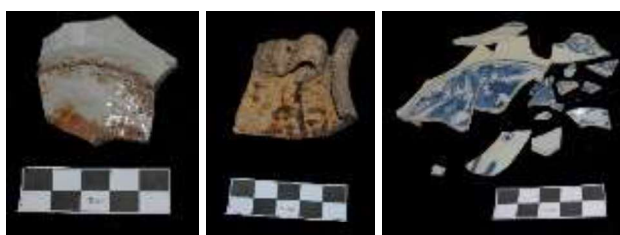
Gambar 2. Fragmen keramik dari situs Kota Lama tahun 2016. Dari kiri ke kanan: Swatow, Sawankhalok, dan Ming (Fujian) (Tjahjono dkk., 2016, 32).

Jenis berikutnya yang ditemukan di situs Kota lama adalah keramik dari Thailand yang berasal dari Sawankhalok