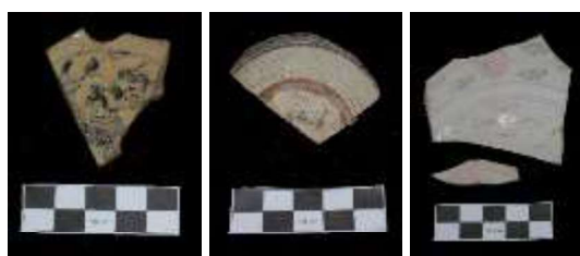
Gambar 3. Fragmen keramik Vietnam asal abad XV – XVI Masehi dari situs Kota Lama tahun 2016 (Tjahjono dkk., 2016, 32).