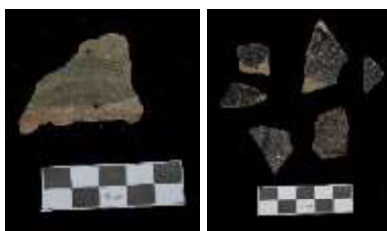
Gambar 4. Fragmen keramik Thailand ( Singburi) asal abad XVI – XVII Masehi dari situs Kota Lama tahun 2016 (Tjahjono dkk., 2016, 32).