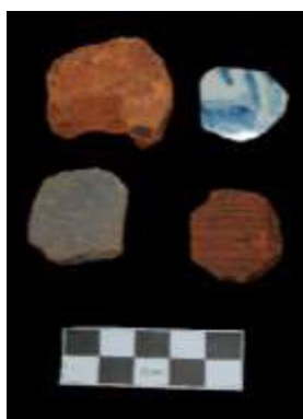
Gambar 5. Fragmen gacuk dari situs Kota Lama tahun 2016 (Tjahjono dkk., 2016, 35)

sampah yang dibuang berbahan tembikar dan keramik. Gacuk tersebut dapat dijadikan sebagai indikasi adanya aktivitas penggunaan ulang artefak yang masih satu konteks dengan sisa sampah lainnya di lokasi tersebut. Hal tersebut dicerminkan dari keberadaan gacuk yang berasosiasi dengan fragmen tembikar dan keramik di dalam satuan matriks lapisan lempung pasiran berwarna abu-abu kehitaman.