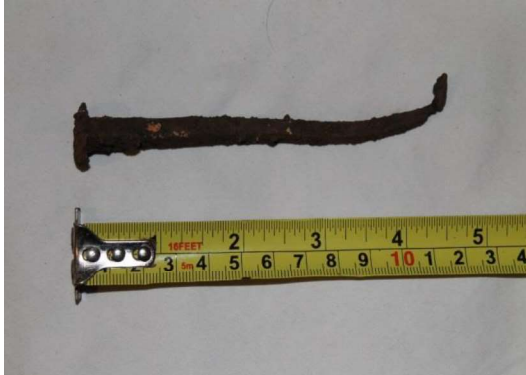
Gambar 3. Paku dari spit 1 TP1

berdiameter 1,8 centimeter. Kondisinya sudah sangat berkarat namun masih dapat diketahui memiliki bentuk yang sama dengan paku sejenis yang ditemukan pada spit 1 TP1 .