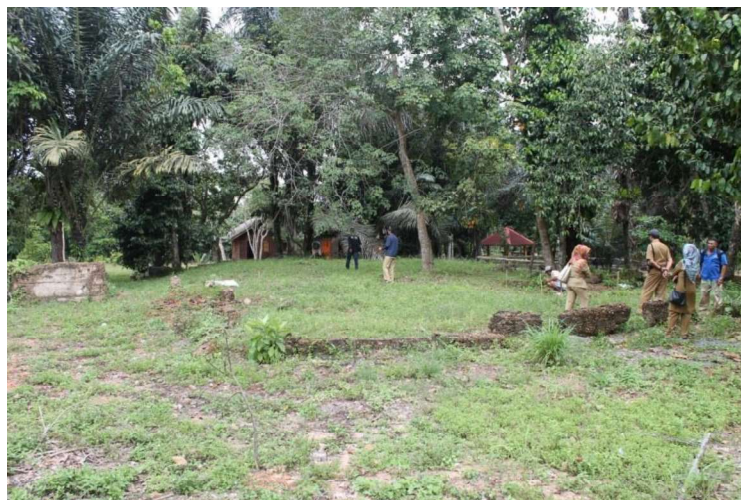
Gambar 2. Lokasi ekskavasi di tahun 2014

Di sudut baratdaya, di bagian luar struktur berbentuk persegi itu terdapat sebuah makam yang ditempatkan dalam pagar tembok. Berdekatan dengan makam itu, di sebelah baratnya juga terdapat sebuah sumur lama yang sekarang telah diperbarui. Adapun di sebelah utara bagian lahan ini dahulu terdapat sumur