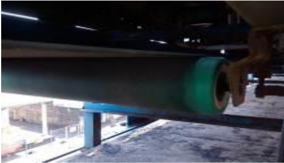
Gambar 2. Submerged Scraper Conveyor (SSC)