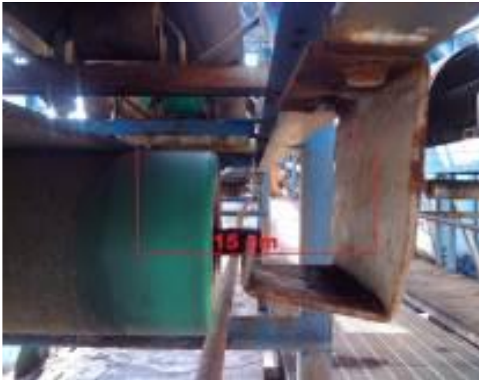
Gambar 3. Support Return Modifikasi Ash Handling

Dengan merubah bentuk dan dimensinya, support return model baru telah berhasil mengatasi masalah belt sobek yang disebabkan oleh gesekan belt dengan support return ketika belt jogging terjadi. Jarak belt dengan support return model baru ketika dipasang yaitu 15 cm, sehingga ketika terjadi belt jogging pada bagian return belt akan tetap aman karena tidak bergesekan dengan support return . Gambar 3 memperlihatkan Support Return Ash Handling yang telah dimodifikasi.