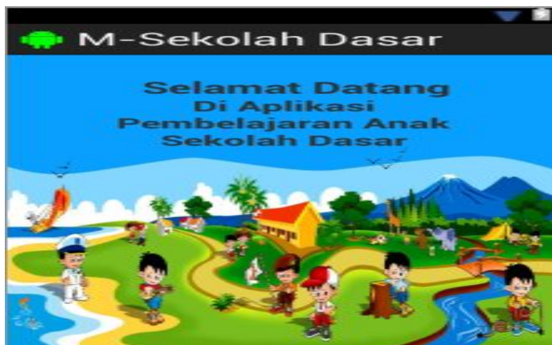
Gambar 2. Tampilan splash screen aplikasi

Setelah aplikasi selesai dibuat sehingga file installasinya yaitu file .apk dapat di install pada smartphone berbasis android. Setelah selesai proses installasinya selanjutnya aplikasi dapat digunakan seperti tampilan Gambar-2 berikut.