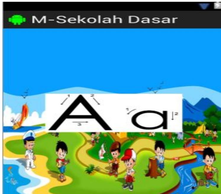
Gambar 4. Tampilan menulis membaca

Pengujian aplikasi dilakukan dengan mengumpulkan sebanyak 5 orang dari setiap kelas peserta didik khusus pada anak didik berada pada kelas-1 Sekolah Dasar yang masih belum lancar untuk membaca dan menulis sehingga total untuk keseluruhan peserta didik ada sebanyak 25 orang.