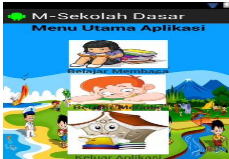
Gambar 3. Tampilan menu utama aplikasi

Tampilan menu utama aplikasi ini dibagi menjadi dua bagian, yaitu menu belajar membaca dan menu menulis seperti terlihat pada Gambar- 3 berikut.