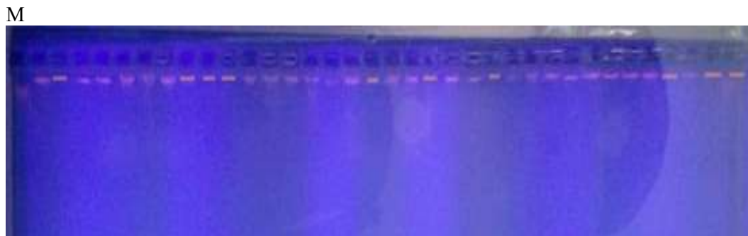
Gambar 1. Hasil elektroforesis isolasi DNA nomor sampel 1-35 Keterangan : M = marker