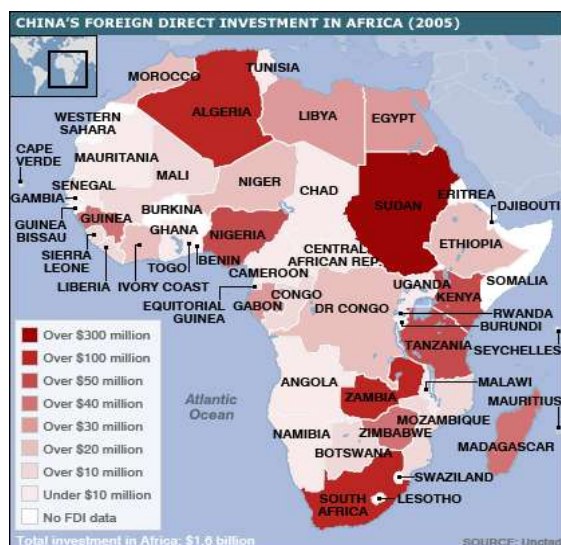
Gambar 1. Persebaran FDI Cina di Afrika pada 2005

Afrika seringkali dilihat sebagai sebuah benua yang ‘tertinggal’ di dunia; tingginya jumlah negara-negara yang bermasalah seperti perang sipil yang berkepanjangan, kemiskinan dan kelaparan, rezim otoriter yang seringkali melanggar hak-hak asasi manusia. Faktor-faktor tersebut memberikan dampak ketidakstabilan domestik bagi negara-negara di Afrika sehingga seringkali melemahkan posisi tawarnya di dunia internasional dan kemampuan diplomasinya bila dibandingkan dengan negara-negara lain seperti negara-negara Eropa dan Asia Timur. Hal ini membuka celah bagi Cina untuk menjalin kerjasama dengan negara-negara Afrika mengingat Cina menawarkan hubungan non-interferensi dengan rekan-rekannya di Afrika. Keterbukaan negara-negara Afrika terhadap Cina mendorong tingginya investasi Cina di Afrika, seperti Foreign Direct Investment (FDI) Cina di Afrika yang pada tahun 2005 mencapai US$1.6 triliun. Peta investasi berikut memberikan gambaran persebaran FDI Cina di Afrika yang cukup tinggi.