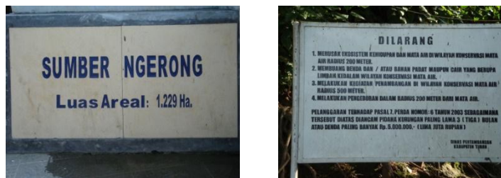
Gambar 2. Sumber Informasi dan Papan Aturan Pengelolaan Sungai dan Gua Ngerong

terdapat di tepi Jalan Raya Rengel (jalan propinsi yang menghubungkan antara Kabupaten Tuban dan Kabupaten Bojonegoro), posisinya terletak di pusat Kecamatan Rengel bahkan berjarak kurang dari 300 meter dari pusat pemerintahan Kecamatan Rengel.