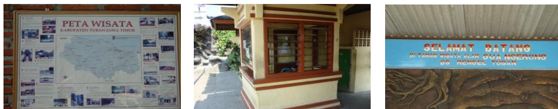
Gambar 5. Sarana Penyambutan Pengunjung Wisata Sungai dan Gua Ngerong

Waktu dimana paling banyak dikunjungi wisatawan pada saat musim liburan sekolah, liburan khusus (misal: Hari Raya dan Hari Libur Nasional), serta hari Sabtu dan Minggu. namun untuk hari-hari biasa kawasan tersebut biasanya sepi pengunjung meskipun masih ada juga beberapa wisatawan yang berkunjung.