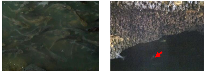
Gambar 6. Ikan, Bulus/Labi-labi (Hanya Terlihat Bagian Kepala, Tanda Panah), dan Kelelawar

Pemberian pakan pada hewan air yang ada di Sungai Ngerong, sebenarnya merupakan atraksi yang menarik perhatian pengunjung yang ada disana. Mereka Banyak Pengunjung yang kagum dengan kerumunan ikan-ikan berjumlah banyak yang saling memperebutkan makanan yang dilemparkan pada mereka. Untuk melihat proses yang menarik tersebut, para pengunjung tidak segan-segan mengeluarkan uang guna membeli pakan yang telah disediakan penduduk di areal wisata tersebut.