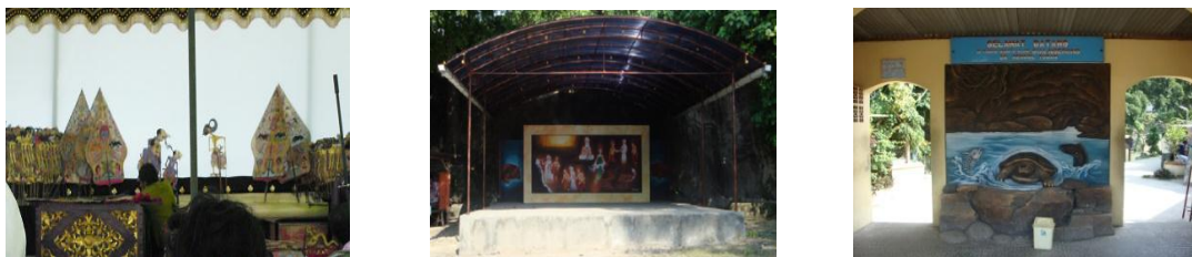
Gambar 7. Sarana dan Prasarana untuk Menjaga Mitos di Sungai dan Gua Ngerong (Pagelaran Wayang pada saat Manganan , Lukisan dan Diorama)

Wayangan, manganan , bersih desa, cerita dari mulut ke mulut, dan gambar-gambar yang terpampang di lokasi yang dalam pembahasan sebelumnya merupakan cara untuk proses sosialisasi pada masyarakat sekitar merupakan salah satu hajatan yang dimiliki oleh pemerintah desa. Pendanaan yang digunakan adalah murni dari kas desa tanpa ada bantuan yang significant dari pemerintah Kabupaten Tuban. Sedangkan untuk proses internalisasi dan enkulturasi dilakukan sendiri oleh warga masyarakat secara informal kepada generasi penerus mereka.