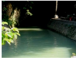
Gambar 4. Sungai Ngerong Sebagai Sumber Pengairan Sawah