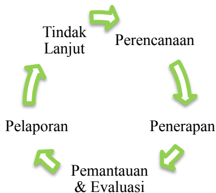
Gambar 1 Tahapan CSR PT. Surya Kertas