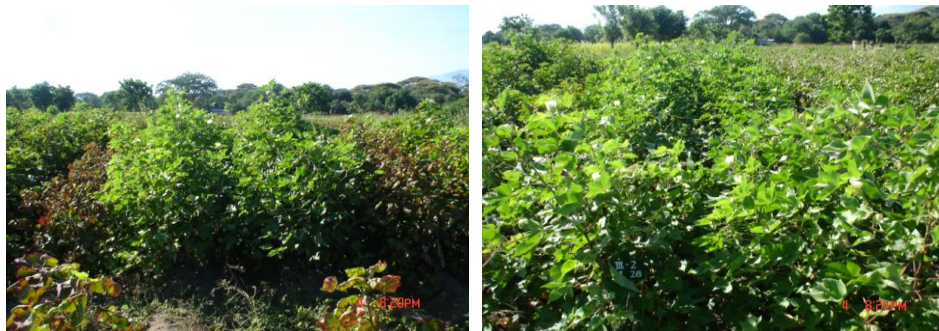
Gambar 2. Tampilan aksesi kapas tahan terhadap serangan A. biguttula

Ditinjau dari kerapatan trikom daun, aksesi-aksesi yang termasuk kategori sangat rentan memperlihatkan tingkat kerapatan trikom daun sangat rendah (<100 helai/cm 2 ). Sebaliknya aksesi yang tahan cenderung menunjukkan tingkat kerapatan trikom daun yang tinggi. Hubungan antara kerapatan trikom daun dan tingkat/skor kerusakan memperlihatkan adanya korelasi negatif ( y = -0,005x + 2,916 ; R^2 = 0,622 ). Hal ini mengindikasikan bahwa aksesi kapas dengan kerapatan trikom