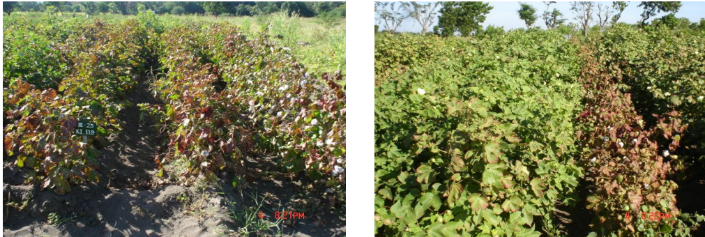
Gambar 4. Tampilan di lapang aksesi kapas rentan dan sangat rentan terhadap A. biguttula