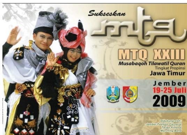
Gambar 2. Baliho MTQ se-Jawa Timur tahun 2009 (Dok. Majalah Halo Jember, 2014)

Selain itu dalam agenda BBJ pada acara MTQ se-Jawa Timur tahun 2009 JFC juga berpartisipasi menampilkan kreasi busana pada baliho/banner yang bernuansa Islam sehingga unsur agama atau kota santri Jember masih dipertahankan sesuai dengan visi misi yang ditargetkan.