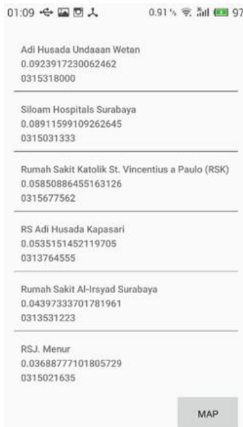
Gambar 3 Antarmuka hasil pencarian