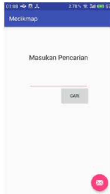
Gambar 2 Antar Muka Pencarian

Antarmuka pencarian pada Gambar 2 berisi textbox untuk menampung kata kunci dari pengguna. Antarmuka hasil pencarian pada Gambar 3 berisi daftar hasil pencarian, baik rekomendasi layanan kesehatan maupun hasil pencarian layanan kesehatan terdekat.