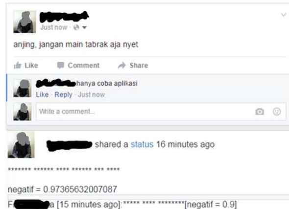
Gambar 4 Tampilan hasil penyaringan status dan komentar

Fungsionalitas yang diuji adalah fungsionalitas menampilkan status dan komentar hasil dari penyaringan serta fungsionalitas mengolah data. Salah satu hasil pengujian ini dapat dilihat pada Gambar 4.