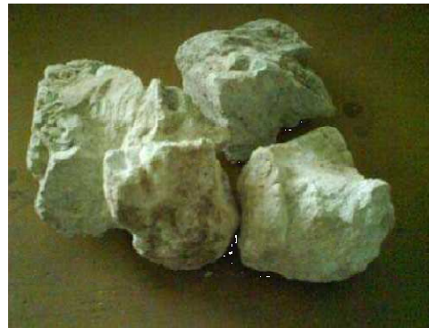
Gambar 1. Bentuk Fisik Bentonite

Bentonit kering mempunyai sifat fisik seperti berupa partikel butiran halus yang berwarna kuning muda, putih dan abu-abu dengan karakteristik sebagai berikut : Massa jenis : 2,2 – 2,7 g/L Massa molekul relative : 549,07 g/mol Bentuk fisik dari bentonit dapat dilihat pada Gambar 1.