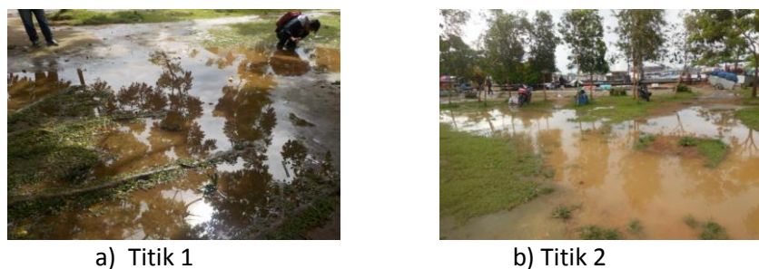
Gambar 3. Area Genangan

Berdasarkan hasil pengamatan, pada Titik 1 didominasi dengan vegetasi pohon berupa trembesi dan mahoni yang berfungsi untuk mengatasi genangan, serta sedikit rerumputan. Begitupula pada Titik 2 mempunyai vegetasi pohon, perdu, dan rerumputan. Pohon yang berperan dalam mengatasi penggenangan dan pelestarian air tanah antara lain akasia, trembesi, mahoni, dan bungur. Namun, Titik 1 dan Titik 2 merupakan area terjadi genangan. Hal ini tidak sesuai dengan pendapat Soeharto (2006) bahwa vegetasi tingkat pohon mempunyai fungsi yang lebih baik untuk meningkatkan kapasitas infiltrasi dan menyimpan air. Genangan yang terjadi dapat disebabkan kondisi tanah yang dangkal sehingga pada saat hujan turun air tidak dapat langsung mengalir ke drainase, sedangkan kapasitas tanah dan kemampuan vegetasi dalam menyerap air mencapai batas maksimal. Selain itu, Titik 1 dan Titik 2 merupakan area yang dipenuhi dengan aktivitas manusia yang berjualan. Hal ini mengakibatkan tanah semakin padat dan minim rerumputan karena adanya pijakan manusia.