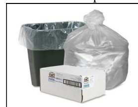
Gambar 5. Perencanaan Wadah Sampah Kapasitas dan ukuran kantong plastik masing-masing wadah sebagai berikut :

Perencanaan pewadahan dan pemilahan sampah dilakukan secara bertahap. Tahap pertama dengan sosialisasi pentingnya memilah sampah organik. Tahap berikutnya dengan pemilahan 2 jenis sampah, yaitu sampah organik dan sampah anorganik. Pewadahan sampah yang direncanakan dengan pengadaan wadah sampah baru yang tertutup, ringan, mudah dipindahkan dan tidak kedap air serta penggunaan kantong plastik untuk melapisi wadah.