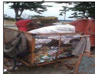
Gambar 2. Contoh Alat Pengumpul Sampah di Wilayah Perencanaan

Pengumpulan. Pola pengumpulan sampah RW 1,2 dan 12 kelurahan Bandaharjo adalah individual tidak langsung, dengan jumlah alat pengumpul 6 dan dilakukan oleh 6 orang petugas. Pengumpulan dilakukan dengan periodisasi setiap hari dengan ritasi pengangkutan 1 kali. Berikut gambar contoh alat pengumpul sampah Kelurahan Bandarharjo: