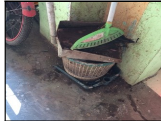
Gambar 1. Contoh Wadah Sampah di Wilayah Perencanaan

Pewadahan. Pola pewadahan sampah RW 1,2 dan 12 kelurahan Bandaharjo adalah individual. Wadah sampah yang digunakan memiliki bentuk silinder dengan volume 40-50 liter, dengan bahan plastik dan karet. Berikut contoh wadah sampah di Kelurahan Bandarharjo :