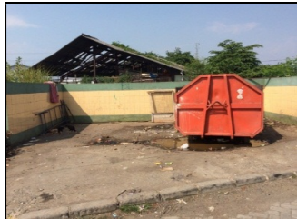
Gambar 3. Lokasi TPS di Wilayah Perencanaan

Pemindahan dan TPS. Pemindahan sampah di Kelurahan Bandaharjo dilakukan pada TPS RW 2 yang terletak di RW 2 Kelurahan Bandaharjo dan TPS RW 1 yang terletak di pinggir dekat pelabuhan Tanjung Mas. TPS yang disediakan terdiri dari masing-masing 1 kontainer yang berkapasitas 6 m 3 , dimana TPS RW 2 memiliki luas sebesar ± 60 m 2 dan TPS RW 1 sebesar ± 45 m 2 .