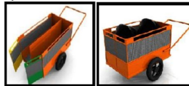
Gambar 6. Rencana Alat Pengumpul Sampah

Untuk tempat pembuangan sampah komunal yang ada di rumah susun tidak dilapisi sekat pemisah untuk jenis-jenis sampah (tercampur), maka dibutuhkan becak sampah khusus yang tidak dilapisi sekat pemisah untuk mengangkut sampah RW 12 ke TPS 3R. Setelah itu baru dilakukan pemilahan sampah berdasarkan jenisnya di TPS 3R.