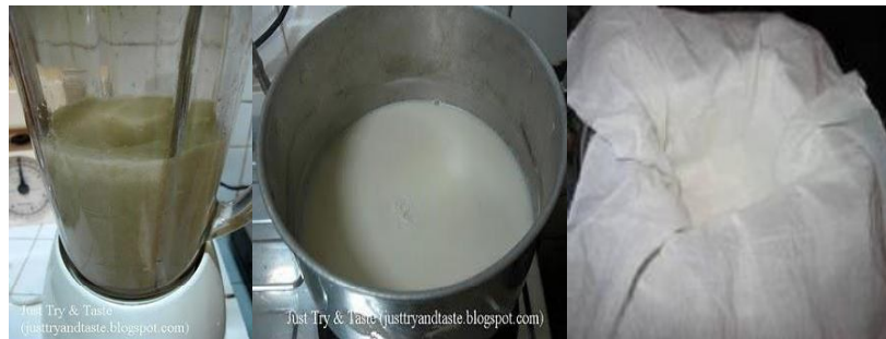
Gambar 1. Rangkaian Alat Koagulasi Susu Kedelai

Alat yang digunakan dalam penelitian adalah baskom, neraca/timbangan, sendok, kompor, stopwatch, gelas ukur, corong, kain belacu, termometer, labu ukur, pipet tetes, blender, oven.