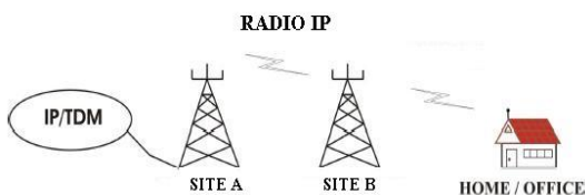
Gambar 1. Konfigurasi Radio Ip

Pada Gambar 1 jaringan transmisi yang dipergunakan adalah jaringan transmisi Radio IP hanya bisa point-to-point yaitu dari BTS A ke BTS B melalui Radio IP sehingga jaringan akses bisa diterima pelanggan. Point-to-point yaitu frekuensi yang digunakan bisa 2,5 G, 5 G, 10 G, 15 G, dst. Point-to-point harus memenuhi kriteria LOS ( Line Of Sight ) yaitu terlihat tanpa ada penghalang di antaranya.