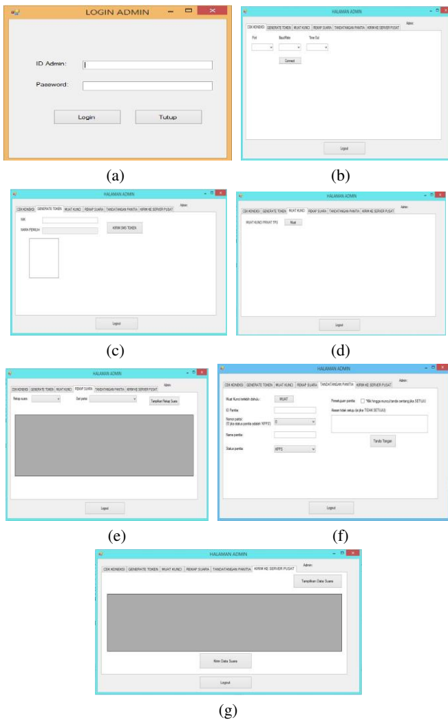
Gambar 3. Implementasi tampilan aplikasi sistem e-voting . Aplikasi ini terdiri dari login admin (a) dan halaman utama terdiri dari enam tab : Cek koneksi (b), Generate token (c), Muat kunci TPS (d), Rekap Suara (e), Tanda Tangan Panitia (f), serta Kirim ke Server Pusat (g).

Penjelasan singkat masing-masing tab tersebut adalah sebagai berikut.