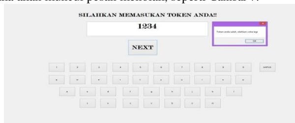
Gambar 7. Pesan yang ditampilkan saat memasukkan data token yang diubah atau dipalsukan.

Sistem aplikasi e-voting ini mempunyai keamanan data dari sisi database yaitu mengamankan agar supaya database tersebut tidak bisa diganti oleh admin. Yang kita amankan adalah menampilkan di field token hasil hash kedua dari token aslinya. Karena hash value nya berbeda dengan total hashrow maka akan muncul pesan menolak, seperti Gambar 7.