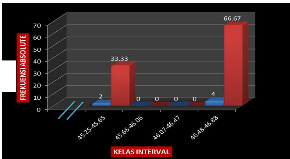
Histogram Daya tahan Kecepatan

Berdasarkan pada tabel 1 pada halaman sebelumnya, distribusi frekuensi dari 6 orang sampel, 2 orang (33.33 %) memiliki daya tahan kecepatan dengan rentang 45.25-45.65, serta 4 orang (66.67 %) memiliki daya tahan kecepatan dengan rentang 46.48-46.88. Untuk lebih jelasnya data daya tahan kecepatan juga bisa di lihat pada histogram bawah ini: