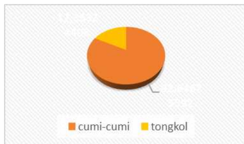
Gambar 4. Grafik komposisi dari jenis ikan yang tertangkap

pi = Kelimpahan relatif hasil tangkapan (%)