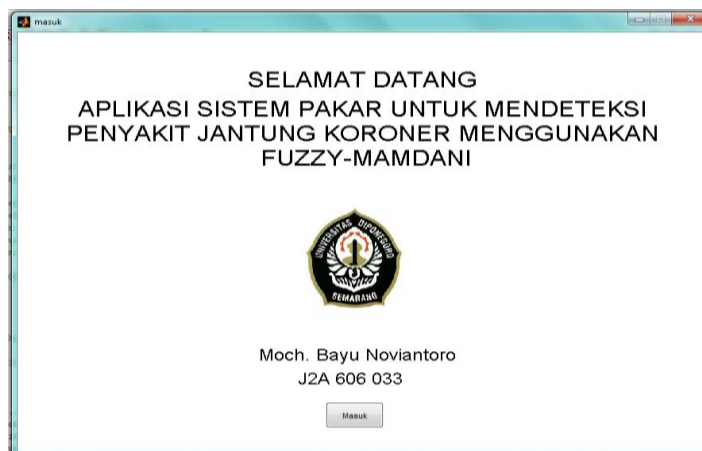
Gambar 2.2 Form - Pembuka

Aplikasi sistem pakar deteksi PJK pada tugas akhir ini dibuat dengan menggunakan program Matlab 7.10.0.499 (R2010a). Antarmuka dalam aplikasi ini terbagi menjadi dua bagian yaitu form pembuka dan form aplikasi.