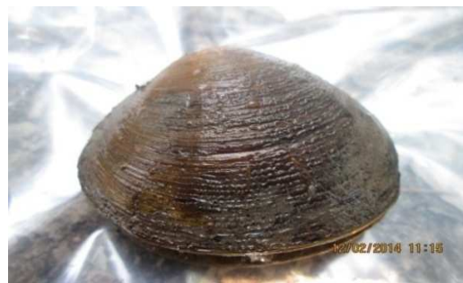
Gambar 1. Polymesoda expansa

Ada dua jenis bivalva yang ditemukan pada kawasan mangrove di Desa Sungai Alam yaitu Lokan ( Polymesoda expansa ) dan Sipetang ( Pharus sp. ).