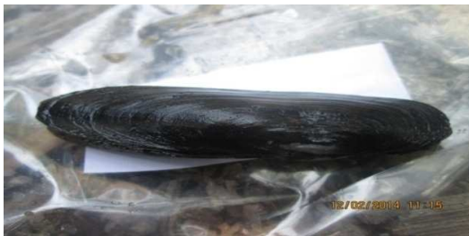
Gambar 2. Pharus sp.

Polymesoda expansa berbentuk oval, bagian luar berwarna kuning pada kerang muda dan kecoklatan pada kerang dewasa. Umbo agak cembung, sisi dorsal datar dan sisi anterior membulat (Jutting dalam Dwiono, 2003).