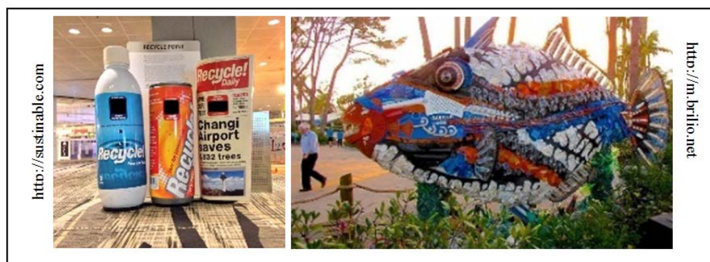
Gambar 4. Konsep image untuk (a) tempat sampah berdasarkan jenis sampah; dan (b) sculpture dari sampah.

mengembangkan bakat maupun ingin belajar mengolah sampah dapat berkumpul pada ruang tersebut. Upaya pengelolaan limbah sampah tersebut ditujukan untuk menciptakan zero waste dengan menerapkan konsep 3R: reduce (mengurangi sampah), reuse (memberi nilai tambah bagi sampah hasil proses daur ulang), dan recycle (mendaur ulang sampah). Selain itu penyediaan ruang untuk komunitas pengrajin limbah sampah ini dapat berhubungan dengan pendekatan green community seperti yang telah disampaikan pada poin 3.2. Ilustrasi untuk atribut green waste disajikan dalam Gambar 4.