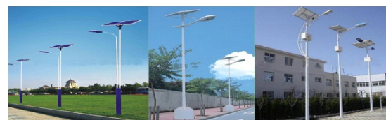
Gambar 2. Konsep image untuk lampu jalan dengan panel surya

Penerapan atribut green energy pada tapak berupa pemanfaatan energi terbarukan yang tersedia pada tapak seperti sinar matahari. Aplikasi dari pemanfaatan sumber energi terbarukan dapat berupa lampu penerangan jalan yang diberi panel surya sehingga setiap lampu memiliki energi sendiri (Gambar 2).