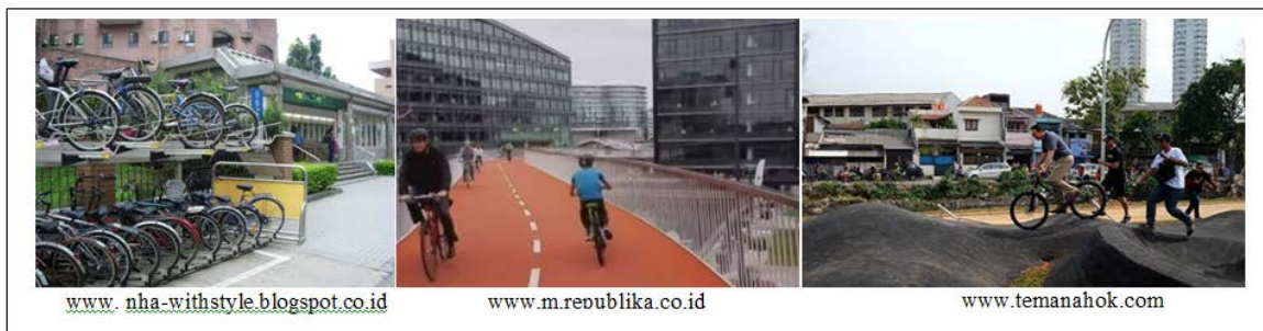
Gambar 3. Konsep image untuk atribut green transportation (a) parkir sepeda; (b) jalur sepeda layang; (c) arena bukit sepeda

memasuki wilayah entrance pada tapak. Sedangkan untuk memasuki tapak disediakan kendaraan ramah lingkungan berupa sepeda yang dapat mengakses keseluruhan tapakserta penyediaan areal parkir sepeda di beberapa titik pada tapak. Selain sepeda, pengguna tapak juga dapat mengakses keseluruhan tapak dengan berjalan kaki. Ilustrasi untuk atribut ini disajikan dalam Gambar 3.