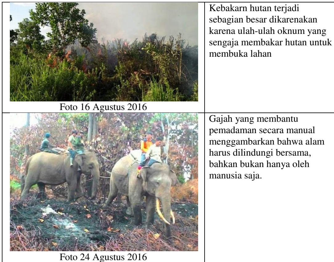
Tabel 5.3: Mitos