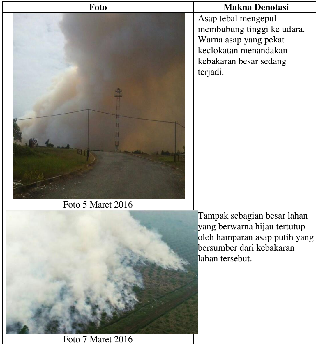
Tabel 5.1: Makna Denotasi