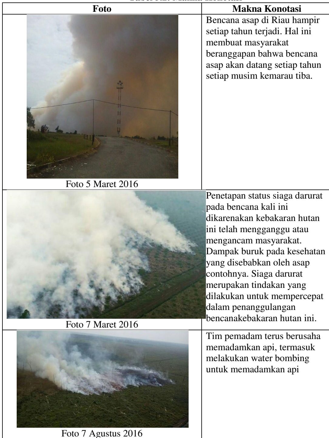
Tabel 5.2: Makna Konotasi