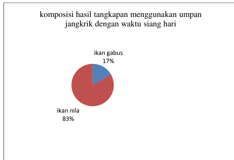
Gambar 1. Komposisi hasil tangkapan menggunakan umpan jangkrik dengan waktu siang hari

Selain tangkapan utama yang berupa ikan gabus ( Ophiocephalus striatus ), ada juga hasil tangkapan sampingan yang diperoleh menggunakan pancing rentengan umpan jangkrik dengan waktu operasi siang hari yaitu ikan nila dengan jumlah sebanyak 5 ekor. Komposisi hasil tangkapan ikan menggunakan umpan jangkrik dengan waktu pengoperasian pada siang hari dapat dilihat pada gambar berikut.