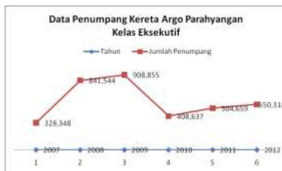
Gambar 1 Data Penumpang Argo Parahyangan Kelas Eksekutif

Keluhan yang dialami oleh masyarakat menjadi tantangan bagi PT. KAI untuk mempertahankan volume penumpang, meningkatkan kepuasan pelanggan dan juga loyalitas pelanggan karena dalam bidang jasa transportasi, fasilitas dan pelayanan adalah hal yang sangat diutamakan. Data mengenai jumlah penumpang kelas Eksekutif Argo Parahyangan Bandung-jakarta dapat dilihat dibawah ini: