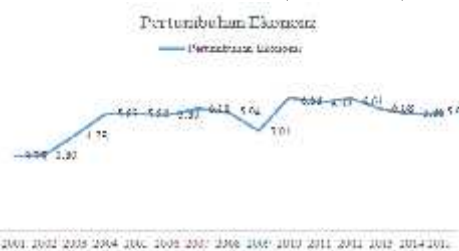
Gambar 2 Pertumbuhan Ekonomi Jawa Timur 2001 – 2015 (Persentase)

Sampai saat ini berbagai kebijakan telah diambil oleh pemerintah untuk mengembangkan dan meningkatkan kemampuan daerah di bidang keuangan daerah, karena aspek keuangan daerah menjadi sesuatu yang penting, sebab dalam proses penyelenggaraan pemerintahan dan pembangunan daerah dibutuhkan dana atau biaya yang cukup besar.