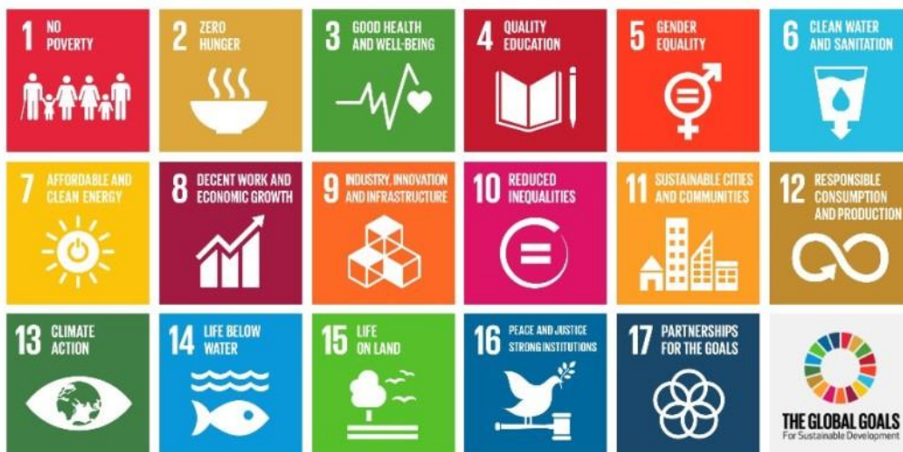
Gambar : Simbol 17 Tujuan Global SDGs

Dalam menjaga keseimbangan tiga dimensi pembangunan tersebut, maka SDGs memiliki 5 pondasi utama yaitu manusia, planet, kesejahteraan, perdamaian, dan kemitraan yang ingin mencapai tiga tujuan mulia di tahun 2030 berupa mengakhiri kemiskinan, mencapai kesetaraan dan mengatasi perubahan iklim. Kemiskinan masih menjadi isu penting dan utama, selain dua capaian lainnya. Untuk mencapai tiga tujuan mulia tersebut, disusunlah 17 Tujuan Global berikut ini.