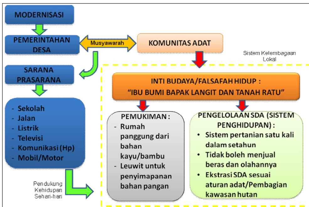
Gambar 2. Bagan Konseptualisasi Eksisnya Sistem Penghidupan Komunitas Kasepuhan Sinar Resmi

Dari dua komunitas kasus, Kasepuhan Sinar Resmi terbukti lebih memiliki ketahanan nafkah dibandingkan Dusun Sumurjaya. Ketahanan ekonomi di Kasepuhan Sinar Resmi terjadi karena sistem kelembagaan sosial menjaga pengelolaan sumber nafkah utama yang menjadi dasar sistem kehidupan masyarakatnya. Kelembagaan sosial asli dengan falsafah dan sebagai inti budaya masyarakat “IBU BUMI BAPAK LANGIT DAN TANAH RATU” selalu dipatuhi oleh anggota komunitas dan direpresentasikan dengan kepatuhan terhadap keputusan ketua adat dalam menerima program pembangunan (modernisasi pedesaan) yang masuk ke wilayahnya. Berbeda dengan Dusun Sumurjaya yang menerima seluruh program Revolusi Hijau dengan terbuka, Kasepuhan Sinar Resmi menolak masuknya modernisasi pertanian tersebut karena tidak sesuai dengan tatanan hidup yang dipegang dan diwariskan nenek moyangnya. Sampai saat ini setiap program pembangunan yang dibawa pemerintah selaku agen perubahan selalu difilter dengan sistem adat yang berlaku dalam masyarakat kasepuhan. Secara ringkas Gambar 2. menunjukkan bagaimana proses modernisasi terjadi di Kasepuhan Sinar Resmi dan kenapa sistem kehidupan masyarakat masih bertahan secara tradisional sampai saat ini.