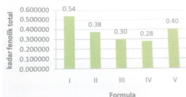
Gambar 1. Profil kadar fenolik total (mg/g ekuivalen asam galat) dari granul effervescent ekstrak rimpang jahe dengan variasi sumber asam