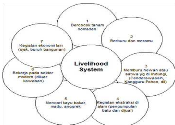
Gambar 1. Sistem Mata Pencapaian Masyarakat

Penghasilan rumahtangga responden meliputi penghasilan yang diperoleh dari hasil pertanian dan hasil kebun (pinang, vanili, kopi, coklat, jagung, pisang, dan mangka) dan penghasilan dari mencari ikan di laut. Total rumahtangga responden yang mempunyai total penghasilan kurang dari Rp.500.000,- perbulan sebanyak 59.23%.