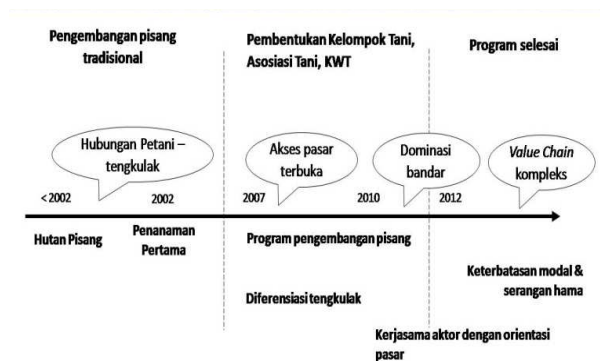
Gambar 1. Timeline Perkembangan Komoditas Pisang

pertanian melalui pengembangan agribisnis yang berkelanjutan dan juga berwawasan lingkungan. Menurutnya, persiapan ketangguhan petani dalam pembangunan pertanian bukan saja diukur dari kemampuan petani dalam mengatur usahanya sendiri, tetapi juga kemampuan dan ketangguhan petani dalam mengelola sumberdaya alam secara rasional dan efisien, berpengetahuan, terampil, cakap dalam membaca peluang pasar. Petani juga harus mampu menyesuaikan diri terhadap perubahan dunia dalam pembangunan pertanian. Oleh karena itu, wajar saja jika program ini menjadikan pisang sebagai komoditas yang dibudidayakan untuk kepentingan komersial.