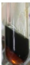
Gambar 1. Skrining fitokimia pada terpenoid.

Keterangan: (+) positif : mengandung golongan senyawa; (-) negatif: tidak mengandung golongan senyawa.