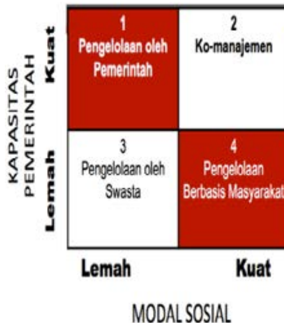
Gambar 5. Matriks Pilihan Model Pengelolaan Sumberdaya Alam

merupakan solusi yang paling tepat (Gambar 5). Seperti yang diuraikan dalam temuan maupun diskusi terlihat kapasitas pemerintah, baik Provinsi maupun Kabupaten, dan juha modal sosial masyarakat lokal sama-sama kuat.