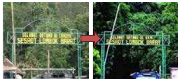
Gambar 3. Penggantian Nama “TAHURA” dengan “HKm” oleh Masyarakat Lokal sebagai Bentuk Penolakan TAHURA

organisasi lokal KMPH (Kelompok Masyarakat Pelestari Hutan). KMPH awalnya merupakan gabungan dari kelompok tani hutan di Desa Sesaot, Desa Lebah Sempage, dan Desa Sedau yang menjadi peserta uji coba HKm pada tahun 1995. Penguatan institusi indigenus dilakukan dengan menegakkan awig-awig pengelolaan hutan Sesaot. Nama “TAHURA Nuraksa” yang dipasang pada gapura di pintu masuk kawasan hutan Sesaot pun dicopot dan diganti masyarakat dengan nama “HKm”.