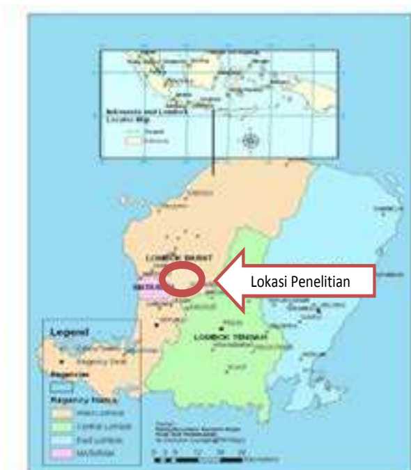
Gambar 1. Lokasi Hutan Sesaot, Lombok Barat

Hutan Sesaot terletak di sebelah barat Taman Nasional Rinjani, memiliki luas 5.950,18 Ha, dan merupakan daerah tangkapan air dari DAS Dodokan. Secara administrasi, kawasan hutan ini terletak di Kecamatan Narmada dan Lingsar, Kabupaten Lombok Barat, dan diapit oleh empat desa, yaitu Sesaot, Lebah Sempage, Sedau, dan Batu Mekar. Berdasarkan SK Menteri Pertanian Nomor 756/Kpts/Um/1982, status dan fungsi hutan Sesaot adalah hutan lindung. Penetapan hutan Sesaot sebagai hutan Lindung didasarkan atas pertimbangan fungsi hutan sebagai sumber mata air bagi irigasi pertanian dan kebutuhan air bersih bagi rumah tangga, khususnya di Kota Mataram, Kabupaten Lombok Barat, dan sebagian Kabupaten Lombok Tengah (Galudra et al, 2010).