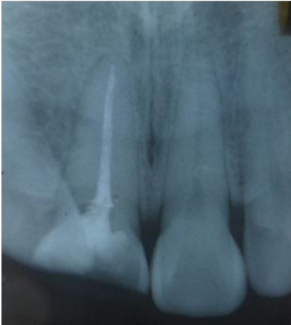
Gambar 4. Radiografis obturasi 11

Kunjungan kedua, 1 Oktober 2012. Kontrol satu minggu setelah perawatan saluran akar. Dilakukan pemeriksaan subjektif dan objektif pada gigi insisivus sentralis kanan maksila. Hasil pemeriksaan subjektif, tidak ada keluhan sakit pada pasien, hasil pemeriksaan objektif, tumpatan sementara masih baik, perkusi dan palpasi negatif. Perawatan dilanjutkan dengan pemasangan pasak, pada kasus ini dilakukan pemasangan pasak fiber (fiber post dentistry). Preparasi saluran pasak diawali dengan pengambilan gutta percha menggunakan Gates Glidden drill . Gutta percha diambil sepanjang 5 mm dari orifis, dilanjutkan preparasi pasak menggunakan Peso reamer nomor 1,2,3. Sebelumnya sudah ditentukan panjang pasak yang masuk ke saluran akar yaitu 2/3 panjang akar, pada gigi ini saluran pasak 18 mm dari titik referensi dan gutta percha yang ditinggalkan 5,5 mm. Dilanjutkan preparasi saluran pasak menggunakan precision drill yang telah disediakan dalam kemasan pabrik. Selanjutnya adalah pemasangan pasak dengan menggunakan semen resin ( Rely X , 3M). Semen diaduk sesuai petunjuk pabrik dan dioleskan ke dalam saluran akar menggunakan lentulo. Pasak fiber dioleskan semen resin dan dimasukkan ke dalam saluran pasak (Gambar 5).