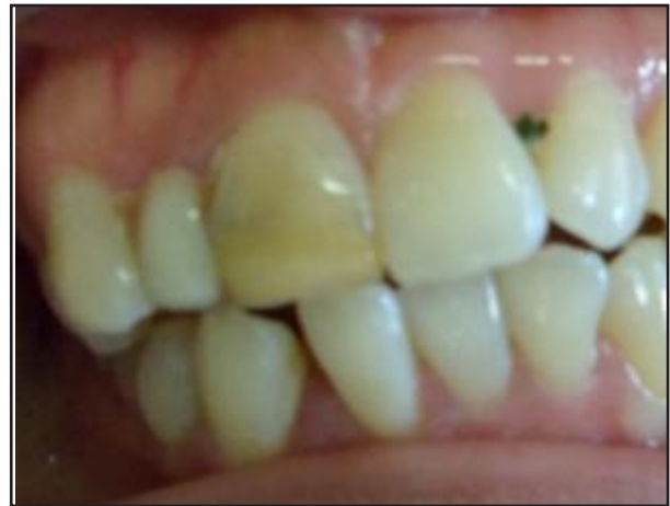
Gambar 1. Gambaran klinis gigi 11

perkusi negatif, palpasi negatif. Pemeriksaan radiograf terdapat gambaran kavitas yang sudah mencapai kamar pulpa. Diagnosis gigi insisivus sentralis kanan maksila adalah pulpa nekrosis. Prognosis baik dengan pertimbangan saluran akar lurus dan terlihat jelas, sisa jaringan keras gigi masih banyak serta tidak ada keluhan sakit (Gambar 1, 2).