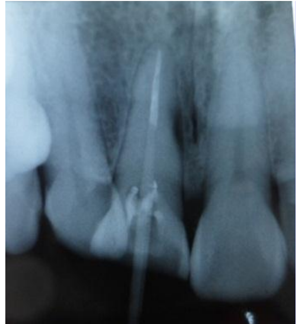
Gambar 5. Radiografis pasak fiber

Kunjungan kedua, 1 Oktober 2012. Kontrol satu minggu setelah perawatan saluran akar. Dilakukan pemeriksaan subjektif dan objektif pada gigi insisivus sentralis kanan maksila. Hasil pemeriksaan subjektif, tidak ada keluhan sakit pada pasien, hasil pemeriksaan objektif, tumpatan sementara masih baik, perkusi dan palpasi negatif. Perawatan dilanjutkan dengan pemasangan pasak, pada kasus ini dilakukan pemasangan pasak fiber (fiber post dentistry). Preparasi saluran pasak diawali dengan pengambilan gutta percha menggunakan Gates Glidden drill . Gutta percha diambil sepanjang 5 mm dari orifis, dilanjutkan preparasi pasak menggunakan Peso reamer nomor 1,2,3. Sebelumnya sudah ditentukan panjang pasak yang masuk ke saluran akar yaitu 2/3 panjang akar, pada gigi ini saluran pasak 18 mm dari titik referensi dan gutta percha yang ditinggalkan 5,5 mm. Dilanjutkan preparasi saluran pasak menggunakan precision drill yang telah disediakan dalam kemasan pabrik. Selanjutnya adalah pemasangan pasak dengan menggunakan semen resin ( Rely X , 3M). Semen diaduk sesuai petunjuk pabrik dan dioleskan ke dalam saluran akar menggunakan lentulo. Pasak fiber dioleskan semen resin dan dimasukkan ke dalam saluran pasak (Gambar 5).