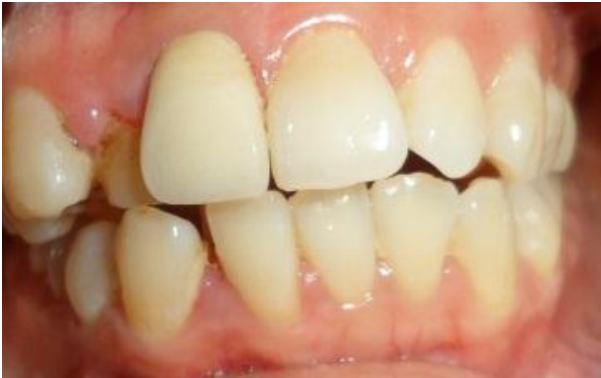
Gambar 6. Inseri mahkota jaket PFM