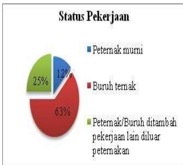
Gambar 1 Status Pekerjaan pada Peternakan Sapi Perah KUNAK

Dari jumlah sampel rumah tangga peternak sapi perah yang ada di KUNAK KPS Bogor, Desa Situ Udik, didapatkan 4 rumah tangga peternak atau sebesar 12 persen berstatus peternak murni, 20 rumah tangga atau sebesar 63 persen berstatus buruh ternak dan 8 rumah tangga atau sebesar 25 persen berstatus peternak/buruh ternak ditambah pekerjaan lain di luar peternakan. Banyaknya rumah tangga dengan status pekerjaan buruh ternak di KUNAK KPS Bogor, Desa Situ Udik ini karena sebagian besar pemilik kavling merupakan para investor yang memperkerjakan buruh peternakan dengan sistem kepercayaan.