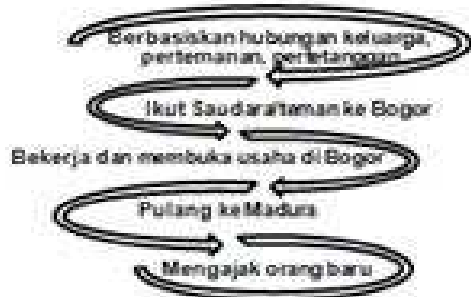
Gambar 3. Proses Migrasi Orang Madura ke Kota Bogor

Selama di Bogor, migran Madura sering pulang ke Madura, khususnya ketika lebaran atau ada acara yang diselenggarakan di Madura. Hal ini merupakan kesempatan untuk menceritakan keberadaan mereka selama di Bogor kepada kerabatnya yang ada di Madura, sehingga cerita tersebut menarik orang Madura lainnya untuk ikut bermigrasi ke Kota Bogor. Gambar 3 merupakan proses migrasi orang Madura ke Kota Bogor.