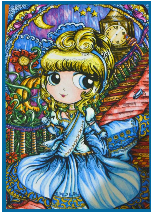
Gambar 3.1 Indian Cinderella, Color Pencil on Paper, 2013

Karya drawing yang menggambarkan penggabungan dari karakter princess dari film-film disney dengan ornamen tradisional India yang menimbulkan kesan India yang lebih pop.