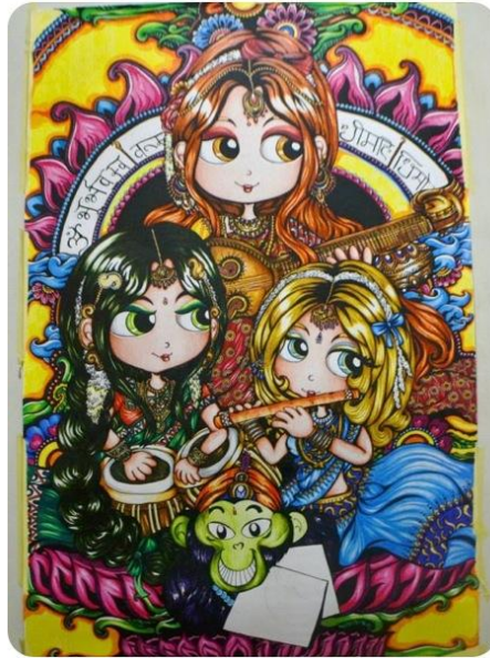
Gambar 3.2 Indian Powerpuff Girls, color pencil on paper . 150 x 100 cm. 2013

Karya besar pertama bertema sama dengan karya seri Indian Disney Princess, hanya karakter yang dipilih disini adalah karakter The Powerpuff Girls. The Powerpuff Girls sebagai salah satu kartun kegemaran seniman di masa kecil, dapat mewakili sifat-sifat salah satu kepercayaan di India yaitu Hindu, sebagai personifikasi Shiva, Vishnu, dan Brahma. Shiva sebagai penghancur yang bersifat keras diwakili karakter Buttercup, Vishnu sebagai pemelihara yang lembut diwakili karakter Bubbles, dan Brahma yang cerdas diwakili karakter Blossom. Seluruhnya tetap dengan nuansa India.