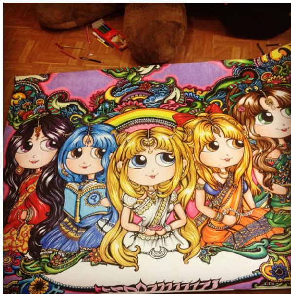
Gambar 3.3 Indian Sailormoon, color pencil on paper . 100 x 160 cm. 2013

Karya kedua mengambil perpaduan antara kebudayaan India dan karakter favorit penulis di masa kecil yaitu Sailor Moon Pretty Soldiers. Karakter Sailormoon dimodifikasi menjadi kaya akan budaya India dengan ornamen-ornamen khas India. Karya ini merupakan eksplorasi perpaduan budaya India dengan gaya khas manga atau komik Jepang.