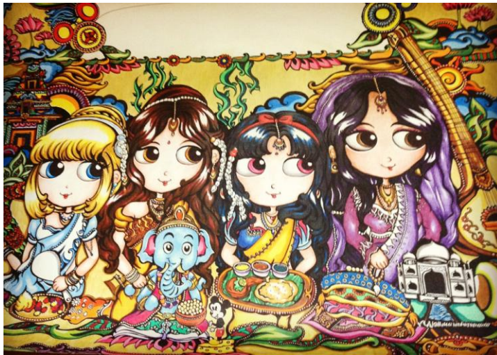
Gambar 3.5 Indian Disney Princess, color pencil on paper . 100 x 150 cm. 2013

Karya kelima menggambarkan kombinasi dari karakter Disney Princess yang dibalut kostum India dan elemen-elemen kebudayaan India yang banyak seperti makanan India, Ganesha, Taj Mahal, Sitar, Kuil, dan Kalung Bunga. Memaparkan tentang hasil eksplorasi seniman terhadap kebudayaan India yang kaya.