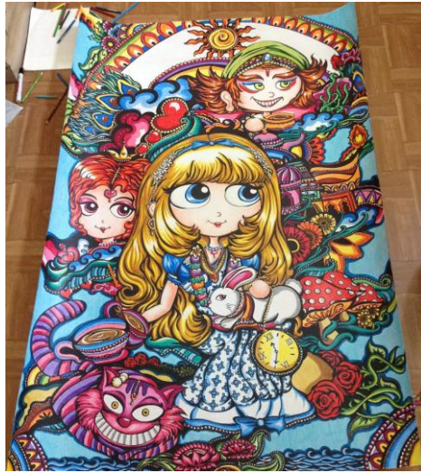
Gambar 3.4 Indian Alice In Wonderland, color pencil on paper . 150 x 100 cm. 2013

Karya ketiga menggambarkan Alice In Wonderland salah satu karakter Disney dalam sentuhan India. Pemilihan karakter Alice ini adalah karena Alice adalah salah satu karakter yang cocok mewakili sifat penulis yang senang mengeksplorasi dan ingin mengeksplorasi lebih banyak. Jikalau Wonderland yang ingin dijelajahi Alice dalam Disney adalah Negeri Dongeng yang diperintah Raja dan Ratu, maka Wonderland yang ditampilkan seniman dalam karya ini adalah Negeri India.