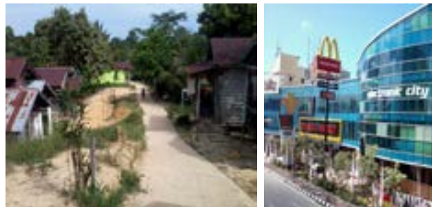
Gambar 4 Kondisi Pemukiman Warga Karang Joang (Kiri) dan Kondisi Balikpapan Kota (Kanan)

daerah Karang Joang, namun pembangunan tersebut sangat jauh berbeda dengan kondisi pemukiman warga Karang Joang. Hal ini dapat lebih jelasnya dapat terlihat pada gambar 4