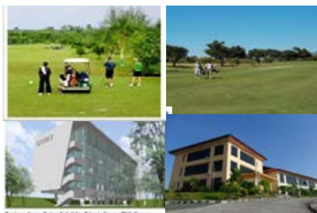
Gambar 3 Karang Joang Golf and Resort (atas), Institut Teknologi Balikpapan (kiri bawah), dan Politeknik Balikpapan (kanan bawah)

Tidak hanya institusi pendidikan saja yang dibangun di Karang Joang. Selain institusi pendidikan, dibangun pula Karang Joang Golf and Resort. pembangunan sarana olahraga dan wisata ini tentunya bukan diperuntukkan bagi penduduk disekitar Karang Joang, melainkan untuk penduduk kota maupun para turis atau warga negara asing yang berkunjung ke Balikpapan. Baik karena urusan pekerjaan maupun wisata. Adapun institusi pendidikan dan sarana wisata daerah Karang Joang antara lain dapat dilihat lebih jelas pada gambar 3.