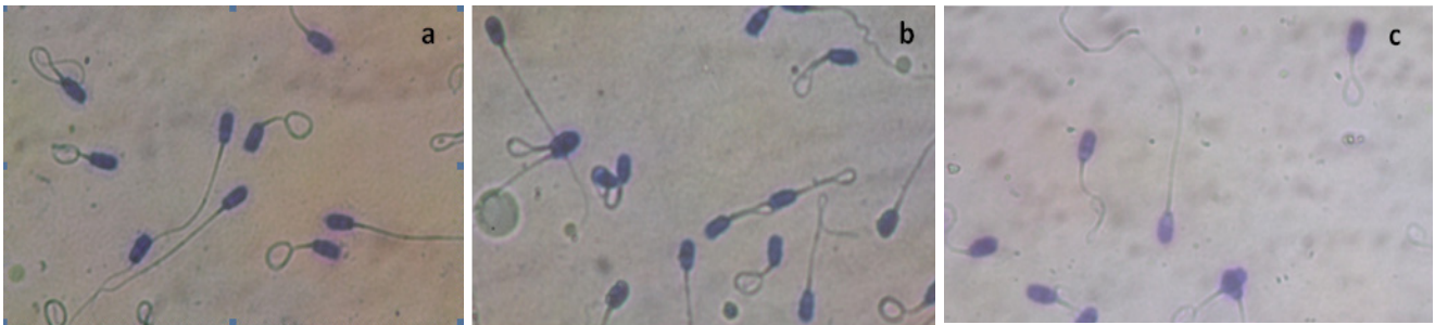
Gambar 2. a) Perbandingan konsentrasi methylene blue dan eosin Y 1:1; b) Perbandingan konsentrasi methylene blue dan eosin Y 1:1(dicampur); c) Perbandingan konsentrasi methylene blue dan eosin Y 1:2

Chelating agent pada ethylenediamine tetraacetic acid (EDTA) diduga menyebabkan kromatin DNA yang keluar dapat terlihat dengan baik. Menurut Muladno (2002), dalam proses isolasi DNA menggunakan LS yang mengandung EDTA berfungsi merusak membran sel secara kimiawi dengan cara mengikat ion magnesium selain itu berfungsi mempertahankan integritas sel maupun aktifitas enzim nuclease yang merusak asam nukleat. Lebih lanjut Corkill and Rapley (2008) menyatakan EDTA berperan untuk menginaktivasi enzim DNase yang dapat mendenaturasi DNA yang diisolasi, EDTA juga dapat menginaktivasi enzim nuklease dengan cara mengikat ion magnesium dan kalsium yang dibutuhkan sebagai kofaktor enzim DNase sehingga membran plasma menjadi tidak stabil.