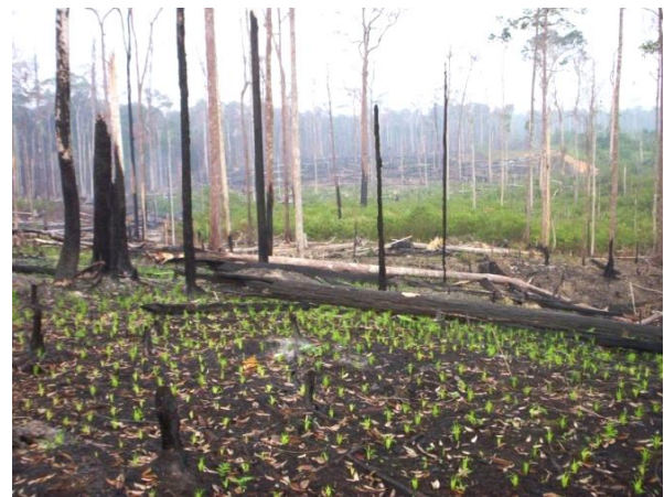
Gambar 2. Pasca pembakaran lahan untuk perladangan berpindah di tanah Ultisol (Podzolik Merah Kuning), di Kecamatan Manuhing, Kabupaten Gunung Mas, Kalimantan Tengah

Kisaran suhu maksimal kebakaran lahan hutan adalah antara 200-300°C, pada perladangan berpindah dengan biomassa >400 t/ha memiliki kisaran 500-700°C, semak antara 300-700°C, dan padang rumput dengan biomassa <1 t/ha menghasilkan suhu <225°C (Rundel 1983 in Neary et al. , 1999).