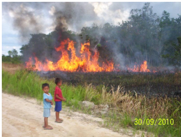
Gambar 1. Pembersihan lahan dengan membakar masih menjadi tradisi di Desa Pendahara, Kecamatan Tewang Sanggalang Garing, Kabupaten Katingan, Kalimantan Tengah

panas; 2) flaming combustion (penyalaan kebakaran) adalah reaksi eksotermik yang cepat dan menghasilkan suhu antara 300-1.400°C fase ini mempengaruhi kondisi tanah; 3) smolding combustion (pembaraan kebakaran) merupakan fase nyala api normal dengan laju penyebaran rendah yaitu 3 cm/jam dan flux panas menurun dengan suhu antara 300-600°C; 4) glowing combustion (periapan kebakaran) merupakan oksidasi residu sangat lemah dari flaming dan smolding , bersifat pembakaran jangka panjang, namun menghasilkan suhu antara 400-700°C; dan 5) extinction (pemadaman) merupakan fase terakhir dimana kebakaran padam (Fuller, 1991).