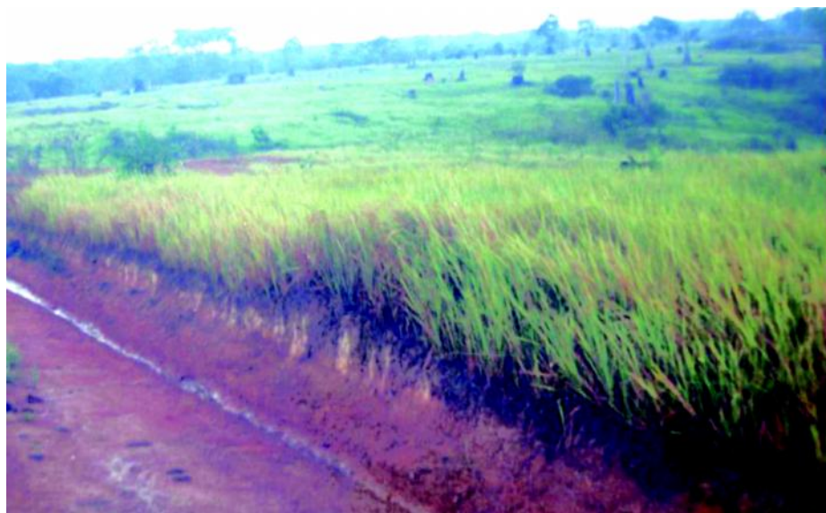
Gambar 1. Bentang alam lahan marginal di Provinsi Kalimantan Selatan.

Uraian tersebut menunjukkan bahwa pada landform tektonik dapat terbentuk berbagai sublandform dan relief, mulai dari datar hingga berbukit atau bergunung. Hal tersebut mengindikasikan bahwa pemanfaatan lahan marginal sangat bergantung pada proses-proses yang terjadi dan kondisi relief lahan. Penyebaran tanah marginal lahan kering dari batuan sedimen masam yang paling