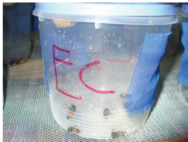
Gambar (Figure) 2. Uji toksisitas cairan nabati pada lebah pekerja Apis mellifera (Toxicity test of essential oils on worker honeybees of Apis mellifera )

Semua koloni lebah yang digunakan sebagai unit percobaan menggunakan kotak type langstroth berisi enam sisiran sarang. Penelitian dilakukan dalam rancangan acak lengkap dengan