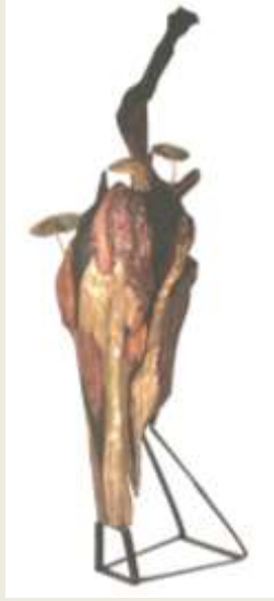
Karya lima: Tergeser kayu jati, tembaga, kuningan, cor kuningan Ukuran: 123 x 88 x 38 cm Tahun: 2009

Karya kelima ini dengan judul “Tergeser” yang artinya penguasa atau pemilik modal berlomba-lomba menebang kayu di hutan illegal logging serta membakar hutan dengan alasan untuk membuka perkebunan sawit, karet, persawahan, dan perumahan serta