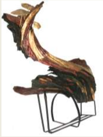
Karya dua: Tumbuh kayu jati, tembaga, kuningan, cor kuningan Ukuran: 151 x 40 x 44 cm Tahun: 2009

Karya kedua menyimbolkan semua makhluk hidup, manusia, binatang, dan tumbuh-tumbuhan butuh hidup, butuh tempat untuk hidup serta butuh sesuatu untuk melancarkan kehidupan. Diibaratkan sebuah keluarga yang tinggal pada sebuah rumah. Di sekeliling pekarangan rumah dibutuhkan adanya tumbuh-tumbuhan, di samping untuk