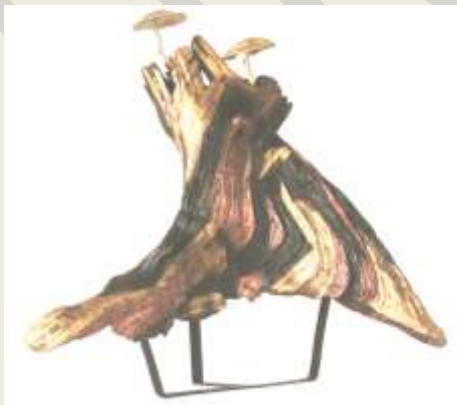
Karya tiga: Tertindas kayu jati, tembaga, kuningan, cor kuningan Ukuran: 76 x 81 x 34 cm Tahun: 2009

keindahan pekarangan dan lingkungan juga untuk penghijauan, menjadi pelindung dari sinar matahari langsung disiang hari serta untuk kesejukan udara dan pandangan mata. Sehingga keluarga yang menempati rumah tersebut semakin nyaman dan tentraman, rukun dan sejahtera.