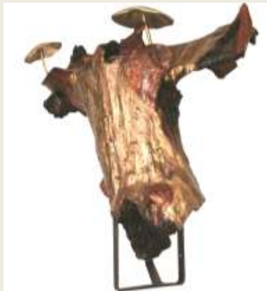
Karya keempat: Biarkan Tumbuh kayu jati, tembaga, kuningan, cor kuningan Ukuran: 65 x 64 x 22 cm Tahun: 2009

manusia untuk lebih menjaga kawasan hutan dan ekosistemnya dengan baik dan bersungguh-sungguh. Begitu juga pemerintah, pengusaha, masyarakat sama-sama mengolah hutan, memelihara alam dan lingkungan. Sehingga kesenjangan sesama makhluk hidup terpelihara dengan baik.