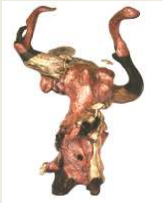
Karya satu: Menunggu Kepastian kayu sonokeling, tembaga, kuningan, cor kuningan Ukuran 90 x70 x56 Tahun: 2009

sedikit perubahan baik dari segi bentuk, penempelan logam tembaga, logam kuningan, maupun model jamur jadi berkembang.